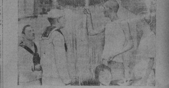
Aquí vemos a los marineros norteamericanos del crucero "Mingano" a desembarcar en Ichang, China, visitando una fábrica nativa de fideos. El fabricante les muestra cómo se traen las pastas de