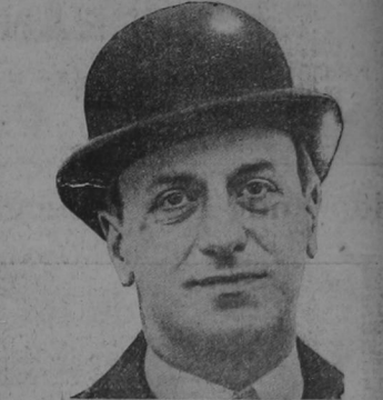
Pierre Wertheimer, notable deportista francés y entusiasta hípico, que acaba de llegar a Norteamérica en viaje de negocios y con el objeto de un "tete-a-tete" con los reyes de los deportes norteamericanos.