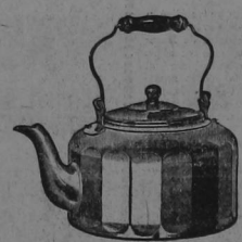
CALDERO DE ALUMINIO Premio No. 403 340 cajetillas LIBERTY