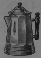
PICHEL PARA CAFE Premio No. 412 400 cajetillas LIBERTY